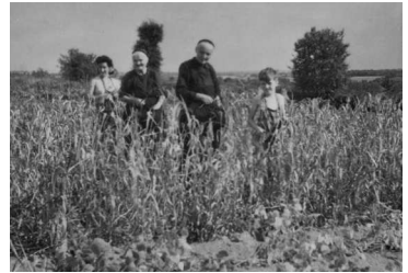
Famille Brébion dans un champ de mil avant la récolte

Le millet cuit dans du lait donne un bon laitage, très consommé dans les années 40/45.